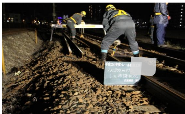
●レール更換状況（上下）