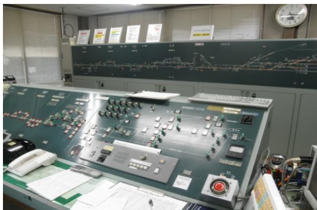
●CTC センター内の状況

CTC センターには全線の信号やポイントの動作、全列車の位置と進行方向などの運行に関する情報が一目で確認できる表示盤と各駅の信号やポイントを遠隔操作する制御盤が設置され、更なる運行管理の効率化及び迅速化、旅客サービスの運転保安度の向上を目指し取り組んでいます。